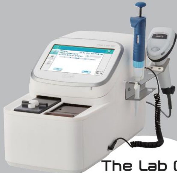
The Lab 002 ザ ラボ 002 蛋白質分析装置

分類：クラスI(一般医療機器) / 特定保守管理医療機器 製造販売届出番号：Z5B1X00001000063 製造販売元：株式会社アークレイファクトリー 製造元：アークレイ株式会社 販売元：アークレイ株式会社