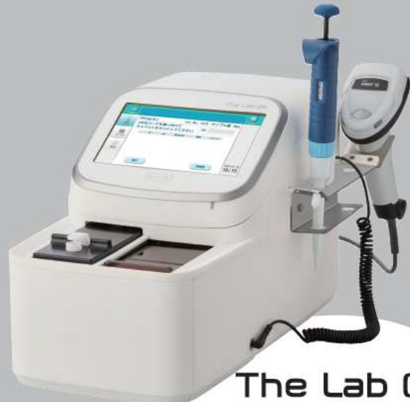
The Lab 002 ザ ラボ 002 蛋白質分析装置

分類：クラスI(一般医療機器) / 特定保守管理医療機器 製造販売届出番号：2581X00001000063 製造販売元：株式会社アークレイファクトリー 製造元：アークレイ株式会社 販売元：アークレイ株式会社